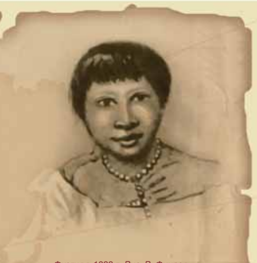
Фуэгия в 1833 г. Рис. Р. Фичроя

Корабль Его Величества «Бигль» вышел в свое историческое плавание 27 декабря 1831 года под ко-