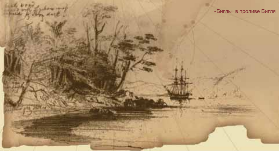
«Бигль» в проливе Бигля

В начале XIX в. в Южной Америке пошла мода на независимость, и вся испанская империя развалилась на кучу республик. Мы-то с вами хорошо знаем, что следует за независимостью: хозяйство немедленно приходит в полный упадок, а независимые государства сразу же начинают ссориться с соседями. Чилийские