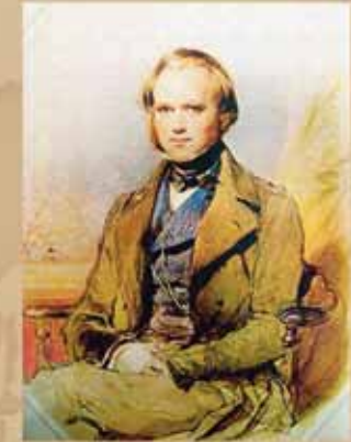
Ч. Дарвин в 1839 г. Худ. Джордж Ричмонд

Так закончился бал нашей Золушки-Фуэгии. В прошлом остались и прием у королевы, и поездка в карете по Лондону, и неспешные прогулки с Дарвином по Риоде-Жанейро. Фуэгия помахала рукой капитану и оста-