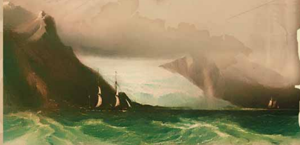
Вид на гору Сарменте

Через год «Бигль» вернулся к форпосту прогресса. Вот как описывает Дарвин это грустное возвращение. «5 марта мы бросили якорь в бухте Вулья, но не увидели там ни души. Вскоре мы увидели приближающийся челнок с развевающимся маленьким флагом; один из мужчин в нем смывал краску с лица. То был бедный Джемми, ныне худой, осунувшийся дикарь, с длинными всклокоченными волосами и голый, с одним лишь кус-