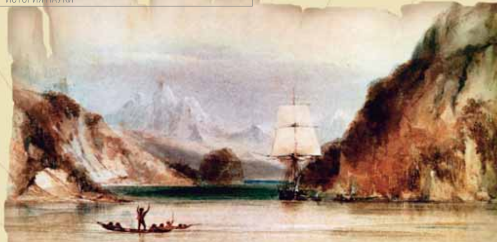
«Бигль» в проливе Мюррея

коз тебе, ни бананов, а вместо доброго друга Пятницы злобные огнеземельцы. И то верно: в таком месте даже у милейшего человека безнадежно портится характер.